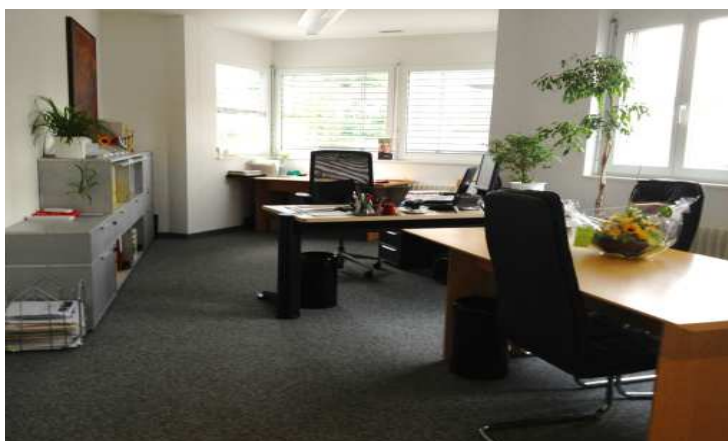
Der helle Büroraum des SIVZ im Büro-Stockwerk des GVZ

Unterdessen ist alles wieder an seinem Platz, die Geräte, Möbel, Ordner, Stifte und was es alles braucht. Die Telefon-, Internet- und Faxleitungen funktionieren, und auch die Kaffeemaschine steht bereit. Sie sind gerne eingeladen, einmal auf einen Kaffee vorbeizuschauen um sich von den neuen Räumen ein Bild zu machen.